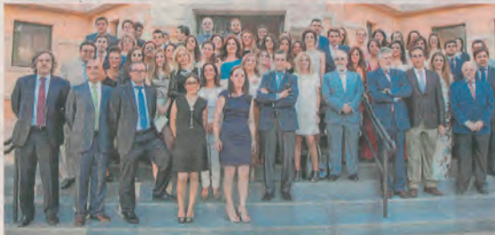
Los graduados 2013/2014 con los docentes y autoridades que asistieron al acto académico de clausura.